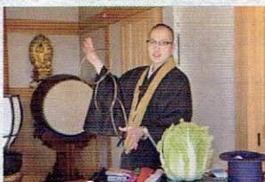
お坊さんマジックショー